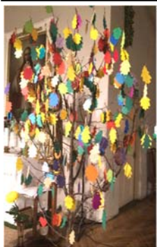
Dvēseļu dienas "dzīvības kociņš" ar mirušo vārdiem uz koka lapiņām