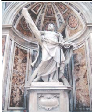
Sv. Apustulis Andrejs