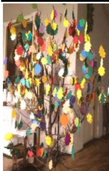
Dvēseļu dienas "dzīvības kociņš" ar mirušo vārdiem uz koka lapiņām