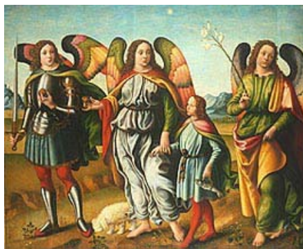
Att. Tobias ar 3 erceņģeļiem - Mihaēlu (pa kreisi), Rafaēlu (kopā ar Tobiasu) un Gabriēlu.

Jāpiemin, ka īpašs uzdevums svētajam Ercenģelim Miķelim par cilvēka dvēseli ir pēdējā cīņā - nāves brīdī. Tas ir - stādīt dvēseli pēc nodzīvotās dzīves Dieva troņa priekšā. Priesteriem dodoties pie mirstošiem, piedaloties pēdējā cilvēka cīņā, ir ļoti svarīga un nepieciešama Sv. Miķeļa aizbildniecība. Ja laimēta ir dvēseles pēdējā cīņa, tad viss ir iegūts. Bet šinī cīņā arī ļaunais gars izlieto visus spēkus, lai dvēseli iebaidītu un iegūtu sev. Tādēļ, lūgšim svētā Ercenģeļa Miķeļa aizstāvniecību par dvēseli pēdējā cīņā.